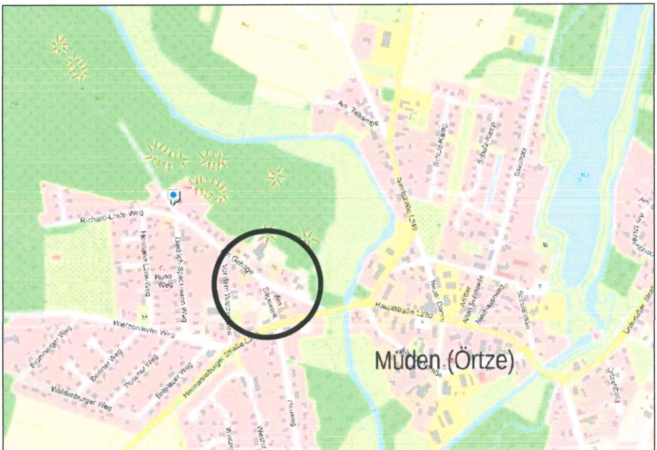
Übersichtsplan: Lage des Plangebietes

Mit der Aufstellung des Bebauungsplanes sollen für den nicht überplanten, derzeit gemischt genutzten Bereich westlich der Wietze bis zur Straße Vor dem Wietzenfelde sowie den unmittelbar südlich der Landesstraße angrenzenden Bereich die planungsrechtlichen Voraussetzungen für eine städtebaulich geordnete bauliche Weiterentwicklung und Nachverdichtung geschaffen werden und das aufgrund der vorhandenen Bebauungsstruktur bestehende bauliche Entwicklungspotential ausgeschöpft werden. Der Geltungsbereich des Bebauungsplanes ist aus den nachstehenden Lageplänen ersichtlich.